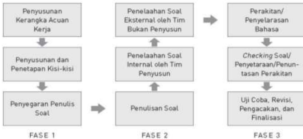
Gambar Tahapan Pengembangan Soal SM UNY

Secara rinci tahapan pengembangan soal dapat dijelaskan sebagaimana gambar berikut.