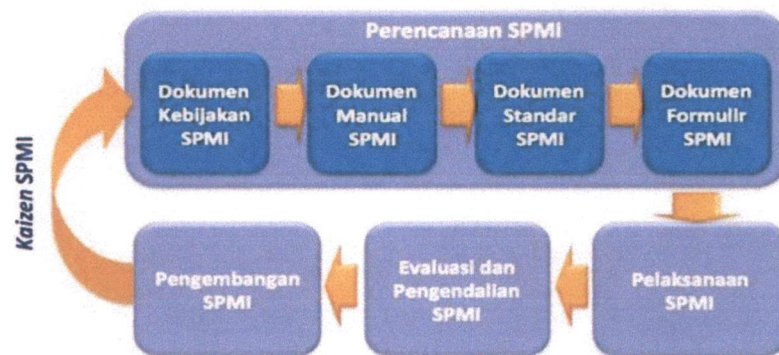
Gambar 1. Siklus Sistem Penjaminan Mutu Internal

Manajemen SPMI UNY dilakukan secara sistemik dan berkelanjutan, dengan menggunakan siklus PPEPP, yakni Penetapan, Pelaksanaan, Evaluasi, Pengendalian dan Peningkatan . Siklus PPEPP dikelola sesuai ciri khas UNY dan dijamin keberlanjutannya ( continuous improvement ) dalam rangka menciptakan budaya mutu di lingkungan UNY. Siklus PPEPP tersebut didasarkan pada Permendikbudristek Nomor 53 Tahun 2023 yang secara ringkas disajikan pada Gambar 1.